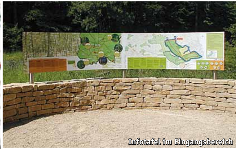
Infotafel im Eingangsbereich