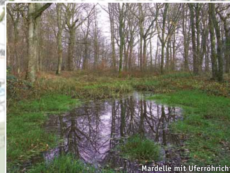
Mardelle mit Uferröhricht