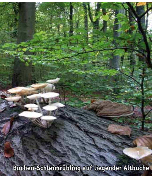
Buchen-Schleimrübling auf liegender Altbuche

Im „Enneschte Bësch“ ringen zwei Waldgesellschaften um die Vorherrschaft: der Eichen-Hainbuchenwald und der Perlgras-Buchenwald. Da die Buchen den tonigen nassen Boden im unteren Hang des „Enneschte Bësch“ nicht vertragen, behält hier der Eichen-Hainbuchenwald mit Stieleiche und Hainbuche die Oberhand. Hangaufwärts gewinnt die Buche auf lehmigen Böden zunehmend an Konkurrenzkraft. Beobachten Sie mit uns das Ringen der Baumarten um die nächste Waldgeneration!