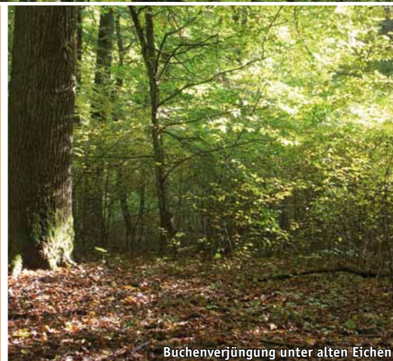
Buchenverjüngung unter alten Eichen

Noch heute spiegelt der „Enneschte Bësch“ mit seinen großkronigen Stieleichen und den lichten Hainbuchen die frühere Nutzungsform wider. Über Jahrhunderte wurde der Waldbestand als Mittelwald genutzt: die mächtigen Stämme freistehender Eichen dienten als Bau- und Möbelholz, die Hainbuchen in der Baumschicht darunter wurden in kurzen Abständen (15 - 30 Jahre) als Brenn- oder Industrieholz eingeschlagen. Die Hainbuchen trieben dann aus dem Wurzelstock wieder aus. Besonders entlang der Waldwege im nördlichen Bereich des Naturwaldreservates können Sie die alten Eichen mit ihren ausladenden Kronen bewundern.