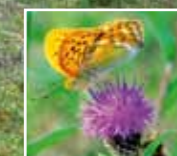
Staudenflur, Lebensraum des Kaisermantels