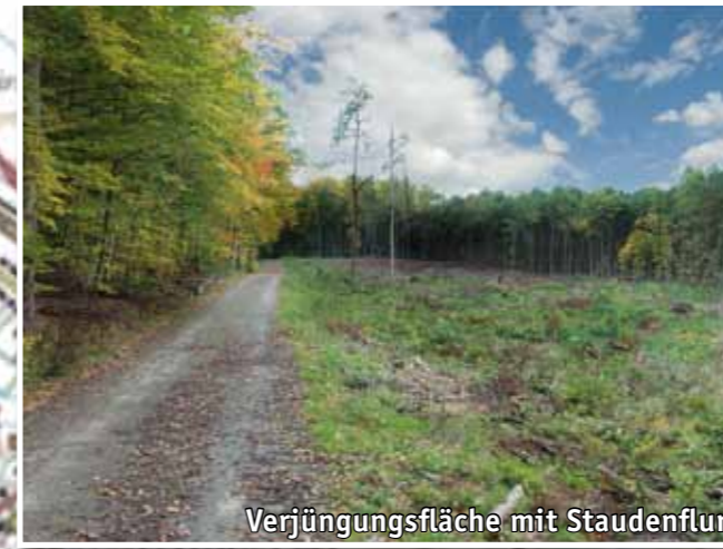
Verjüngungsfläche mit Staudenflur