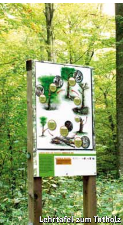
Lehrtafel zum Totholz