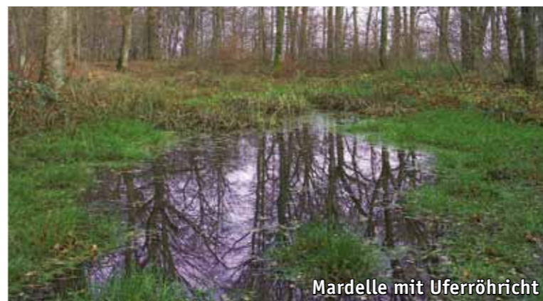
Mardelle mit Uferröhricht

Der „Enneschte Bësch“ mit seinem alten Baumbestand beherbergt schon heute bemerkenswerte Tierarten: Die seltene Bechsteinfledermaus wurde hier nachgewiesen. Auch die Spechte (Kleinspecht, Grünspecht, Mittelspecht) und Greifvögel (Habicht, Rotmilan, Schwarzmilan) fühlen sich in den großkronigen Altbäumen wohl. Achten Sie auf die Vielfalt der Tier- und Pflanzenwelt, Sie werden in jeder Jahreszeit andere Entdeckungen machen.